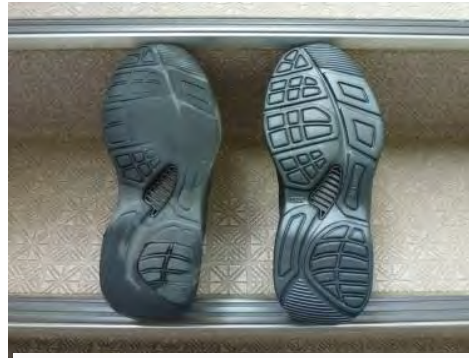
左の靴はすり減っていて危険です

すべりやつまづきによって転倒しないように、次の点に注意して就業用の靴を選ぶことをお勧めします。