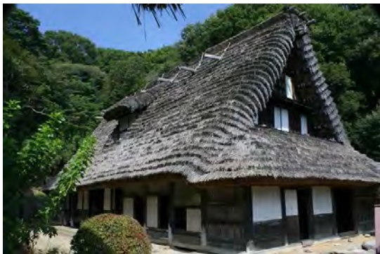
日本民家園での合掌造り

この民家園は消滅しつつある古民家を将来に残そうと昭和42年(1967年)に開園したとのことです。いろいろな古民家を始め、水車小屋、船頭小屋、高倉、農村歌舞伎舞台など、20数軒