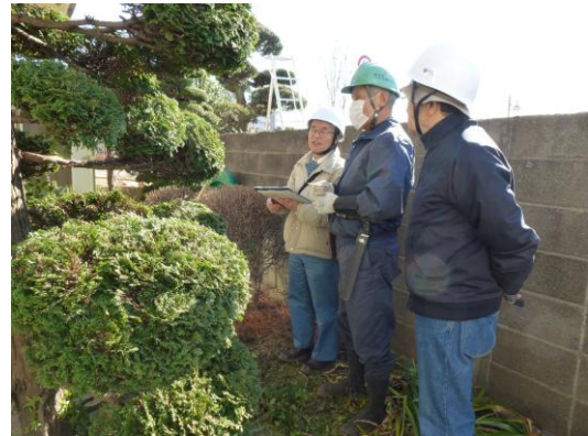
植木班の現場をパトロール