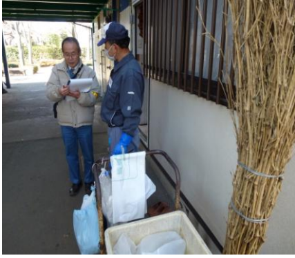
会員から聞き取りする指導員

植木剪定作業では、発注者へのあいさつから始まり、就業会員には聞き取りをしながら健康・適正就業のチェックが行われました。清掃作業では、敷地内を歩き、事故事例を挙げ、階段清掃等の危険箇所を確認後、就業会員への聞き取り調査で就業現場の巡回を終えました。